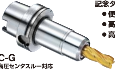
C-G 高圧センタスルー対応 (MAX. 7MPa)