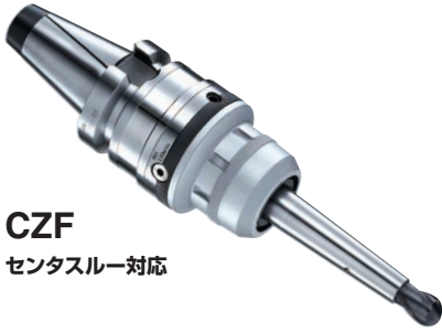
CZF センタスルー対応