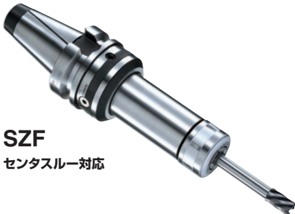
SZF センタスルー対応