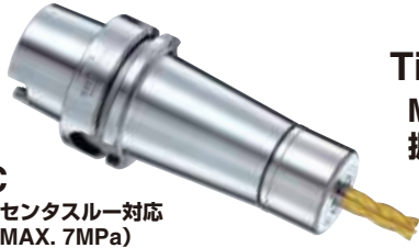
VC 高圧センタスルー対応 (MAX. 7MPa)

TiNベアリングナット標準付属 MAX.40,000min -1 & G2.5 振れ精度 4D先端 3μm以内