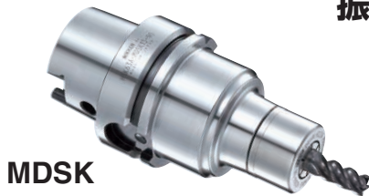
MDSK センタスルー対応