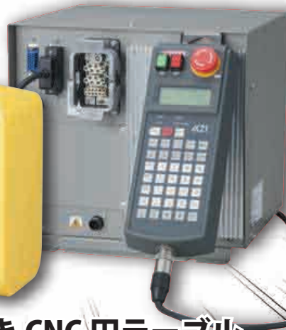
コントローラ付き CNC 円テーブル