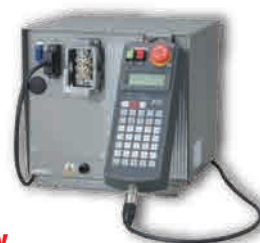
New AR21コントローラ (400W,750W用) 入力電源:単相AC200/220V 寸法:300×280×285, 10kg