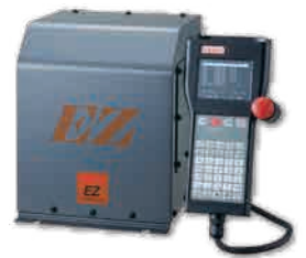
EZコントローラ (1.0KW用) 入力電源:単相AC200/230V 寸法:225×275×260