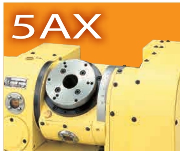
傾斜CNC円テーブルシリーズ